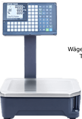
Wägebereich 6/15kg Teilung 2/5g