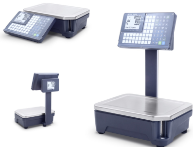
Wägebereich 6/15kg Teilung 2/5g